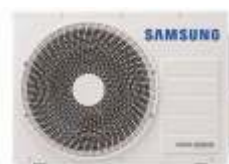
18 & 24k BTUs