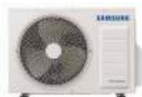
9 & 12k BTUs